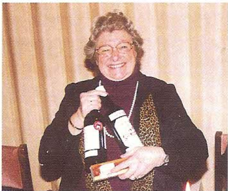
En glad vinder

Foreningen kunne til den årlige lodsejerfest på Mou Hotel samle en stor del af lodsejerne. Denne fest har nu helt faste rammer med velkomst af formanden – fællessang – kort tale af formanden – lidt godt til ganen og så det store bankospil.