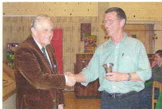
Still going strong. Næststørste havørred i 2002.

Det er fremtidsmusik, men alligevel en tanke værd. Bestyrelsen vil i hvert fald inddrage det i overvejelserne over tiltag i 2004.