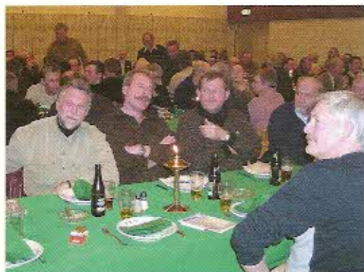
Mon de hygger sig?

Det samme problem kan opstå i år igen. Derfor er det et spørgsmål, om det ikke ville være klogt at suspendere reglen om de 800 seniormedlemmer, til tiderne har ændret sig, og medlemstallet er blevet stabilt igen?