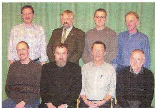
Bestyrelsen efter generalforsamlingen: